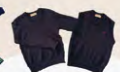
ベスト・セーター