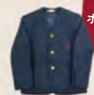
ジャケット (男女共通)